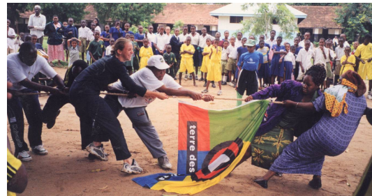
‘Tug of war’ tussen leerkrachten en ouders op de sportdag in Tanga

Verder stonden er in de maand mei vijf sportdagen gepland en twee gebarentaal workshops. We zijn klaslokaaltjes aan het bouwen, willen een manual maken voor physical education, en het leerplan voor de leraren opleiding voor speciaal onderwijs aanpassen. Er zijn 15 geestelijk gehandicapte kinderen naar Ierland voor de World games.